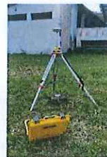
Taller ASOSUMACO -Loreto