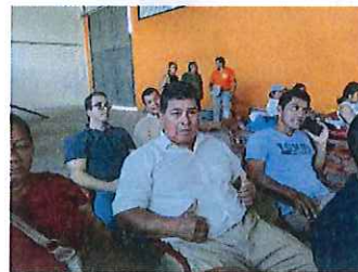
Reunión Viceprefectura, lastrado Itaya Unión Amazónica.