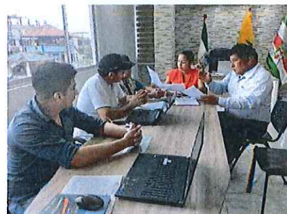
Sesión lanzamiento de la Agenda de la agenda local de protección de derechos de los ciudadanos del cantón Shushufindi.